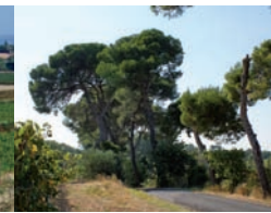
Allée de Brescou