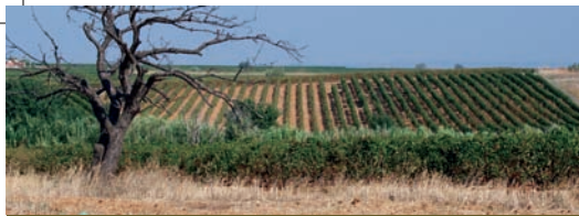
Bosquets et Domaines