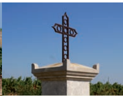
Croix de Brun